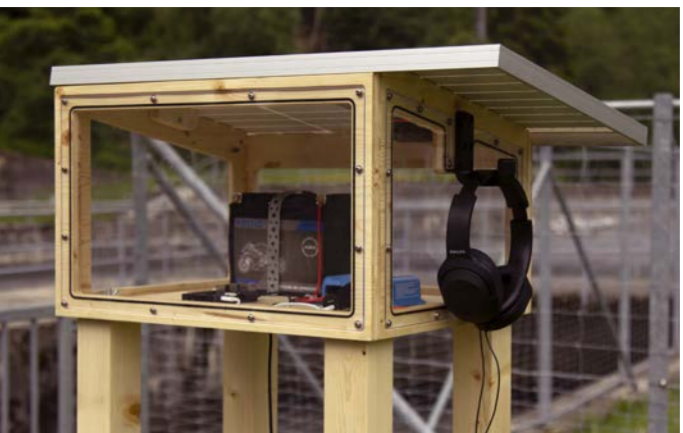
Safien Platz, KWZ Kraftwerke Zervreila - GPS: 46.678070, 9.315620 Ab Safien Platz ca. 5 Min.

Dieser «Song» ist eine spekulative Oper über Wut und Widerstand der artenübergreifenden Zombie Mermaids, die gegen etablierte Mächte/rw Hände, deren Nägel mit Miniatur-Wasserwagen verziert sind, einem paradoxen Werkzeug: ein rationales Instrument, das doch fluider Natur ist. Dies verweist sowohl auf den Ausstellungsort, an dem aus Schmelzwasser Energie für den menschlichen Bedarf erzeugt wird, als auch auf die tiefgreifende Beziehung zwischen Umwelt, menschlichem Körper und technischer Anwendung. (AF)