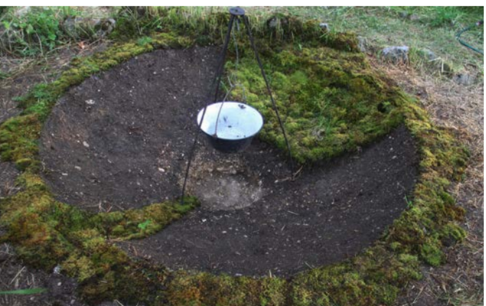
Berghotel Alpenblick Tenna GPS: 46.746883, 9.339274