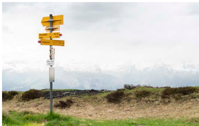
A Versam: Rössli - GPS: 46.791260, 9.338420, ab Versam (Dorf) 3 Min. B Tenna: Mitte - GPS: 46.746752, 9.338783 C Tenna: Tenner Chrüz - GPS: 46.760000, 9.332820, ab Tenna (Mitte) ca. 1.5 Std D Safien Platz: Brücke - GPS: 46.681794, 9.314963 E Thalkirch: Turra - GPS: 46.624913, 9.276483