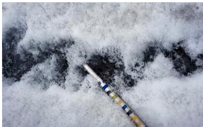
Thalkirch, Kirche GPS: 46.637950, 9.280160