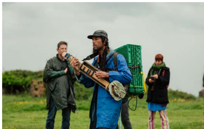
Kunst Garage Versam, Hauptstrasse - GPS: 46.79120, 9.33817 Ab Versam (Dorf) 3 Min.

Dieses Gesamtkunstwerk, bestehend aus einer Reise, einer Installation und einer Performance, ehrt die Kultur und das Überleben des Nomadischen. Wabs mehrwöchige Reise per Anhänger von Cornwall (UK) ins Safiental führte ihn zu Künstler:innen, Aktivist:innen und Landprojekten. Diese Begegnungen dokumentierte er mit aus recycelten Batterien hergestellten Aufnahmeegeräten sowie mit Drucken, für deren Herstellung er Sonnenfrequenzen nutzte. Die Installation und Klangperformance in Versam spiegeln die Weltanschauungen und Stimmen wider, denen er auf seiner Reise begegnete. (AF)