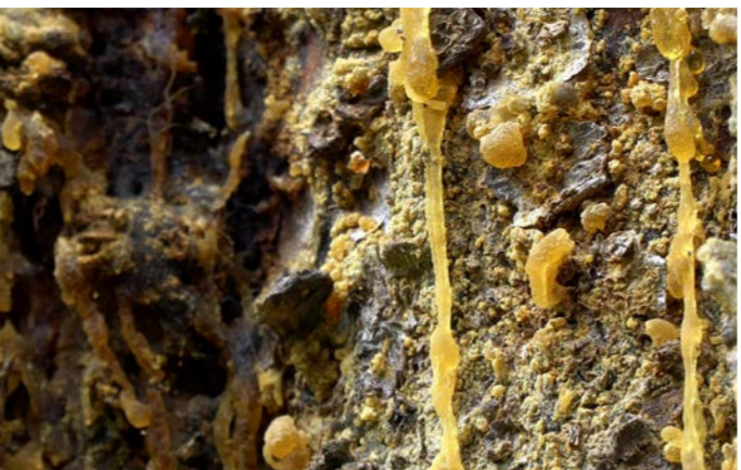
Tenna, Innerberg - GPS: 46.740160, 9.332570 Ab Tenna (Mitte) ca. 15 Min.