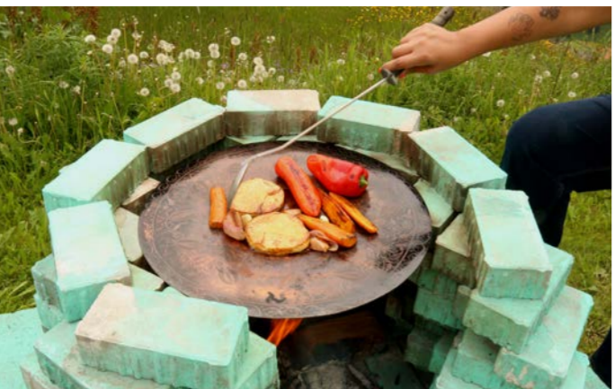
Berghotel Alpenblick Tenna GPS: 46.7468833 / 9.3392738

Breastworks ist weniger ein Werk nur zum Betrachten, die Arbeit stellt vielmehr einen sozialen und kulinarischen Raum in Tenna her. Sie thematisiert die Wichtigkeit von Care- und Hausarbeit, die die Dorfbewohner:innen seit Generationen leisten. Der dabei praktizierte Austausch findet auf Brusthöhen statt: Hierzu zählt ein ortsspezifischer Ofen, ein Menü mit dem Hotelkoch, treffen mit ansässigen Frauen zur Entwicklung eines «Spissäcklis» für Besucher:innen, womit der Kochbereich aktiviert wird. Das Verpflegungspaket ist im Berghotel Alpenblick und in lokalen Hofläden erhältlich. (AF)