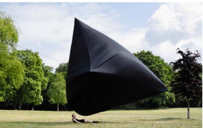
Valendas, Altaun - GPS: 46.78789, 9.28250 Die Performance findet einmalig am 15. September im Rahmen des Dorffests von Valendas statt.

Unser Ökosystem hängt von der Sonne ab, die auf die Erde blickt, Leben schafft und vernichtet. Die Performance ist ein Ritual für unsere Zeitalter, das mit der Aeroocene Foundation produziert wurde – sie zeigt eine aufgelassene Skulptur, die vom Wind getragen wird und nur dann abhebt, wenn sie von Sonnenstrahlen berührt wird. Die Skulptur gibt den unsichtbaren Kräften, die uns umgeben, einen «Körper» und verbindet erdgebundene Tänzer:innen mit den luftigen und kosmischen Welten. Nach der Aufführung wird einen Workshop zum Thema Tanzen mit der Atmosphäre angeboten. (JL)