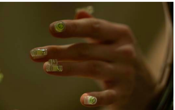
Safien Platz, KWZ Kraftwerke Zervreila Stollen - GPS: 46.677820, 9.316620 Ab Safien Platz ca. 10 Min.