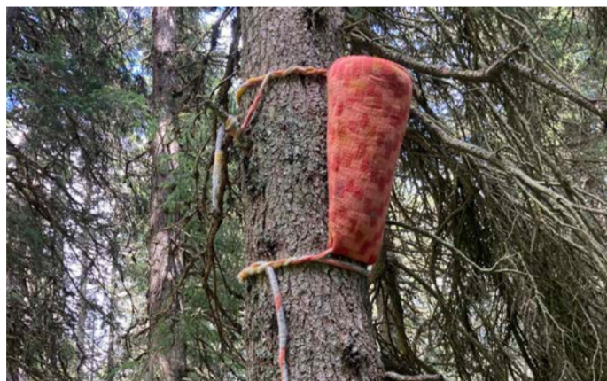
Thalkirch, Bawal - GPS: 46.647260, 9.274630 Ab Thalkirch, alte Post ca. 25 Min.