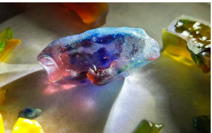
Berghotel Alpenblick Tenna GPS: 46.746883, 9.339274