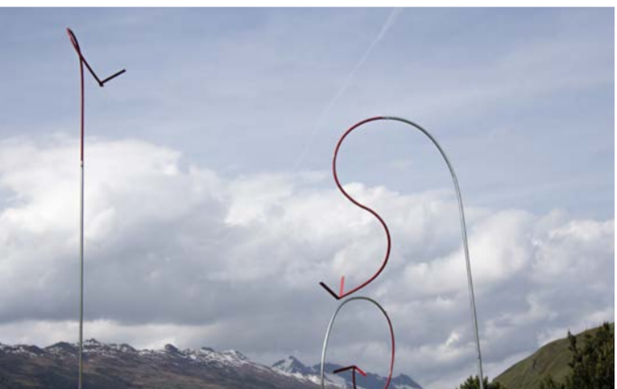
Thalkirch Turrahas, im Sand - GPS: 46.622357, 9.278189 Ab Thalkirch, Turra ca. 10 Min.