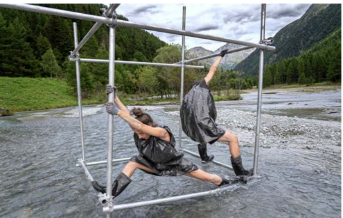
Tenna: Tenner Chrüz - GPS: 46.759300, 9.334180, ab Tenna (Mitte) ca. 1.5 Std. Stall an der Strasse auf Tenner Alp - GPS: 46.748120, 9.334090, ab Tenna (Mitte) ca. 20 Min.