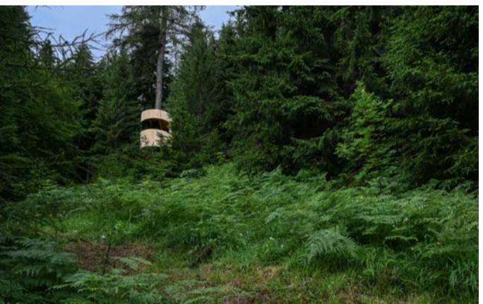
Aclatobel GPS: 46.768600, 9.351050, Ab Nordportal neues Acla-Tunnel ca. 10 Min

Seit Sommer 2021 werden die mikroklimatischen Bedingungen und die Soundscape des Aclatobles beobachtet und aufgezeichnet. In einem Horchposten in Form eines Baumhauses mit Konsole und Kopfhörern können die Besuchenden mit dem Beobachtungssystem und den Aufzeichnungen interagieren und diese erkunden. www.acla-soundscape.ch