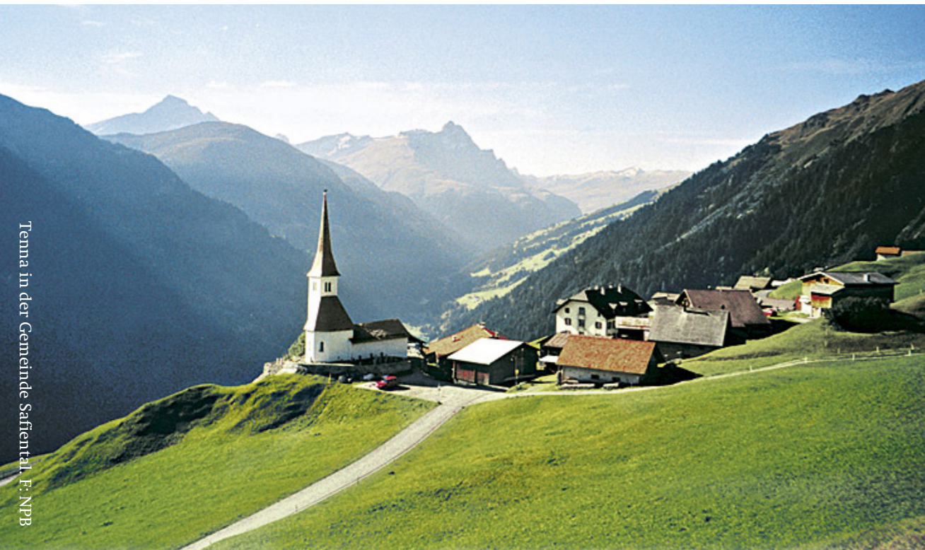
Tenna in der Gemeinde Safiental.