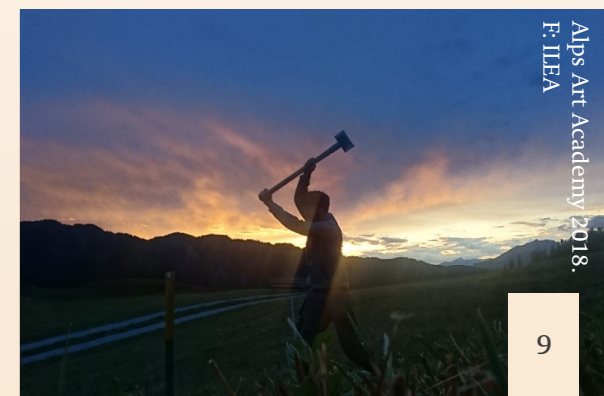
Alps Art Academy 2018, F. ILEA