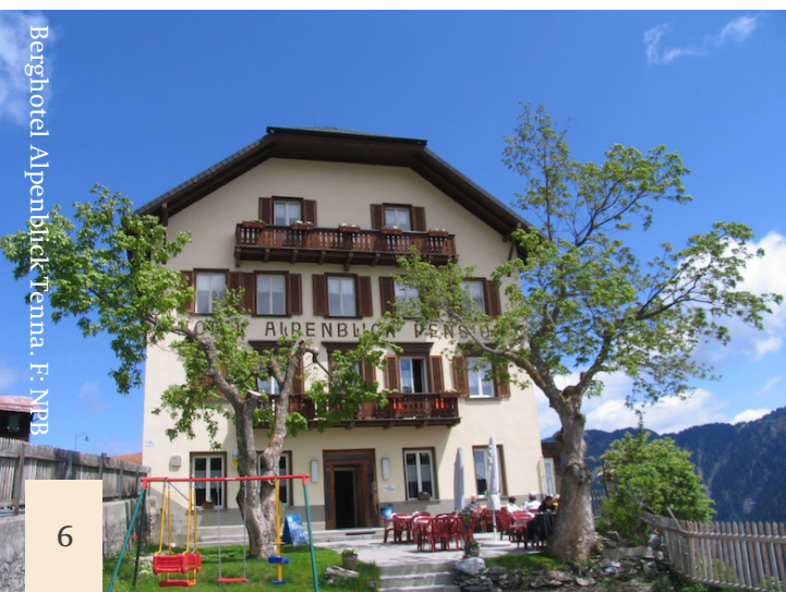
Berghotel Alpenblick Tenna.

Das 1902 bis 1906 im Stil der Belle Époque erbaute Berghotel Alpenblick ist auch Sitz von ILEA, welches im Hotel neben der Geschäftsstelle auch eine Bibliothek und eine Künstler- und Forschungsresidenz aufbaut, sowie wechselnde Ausstellungen zeigt. Ebenso ist das Hotel Informationszentrum der jeweils parallel zur Akademie stattfindenden Outdoor Biennale ART SAFIENTAL.