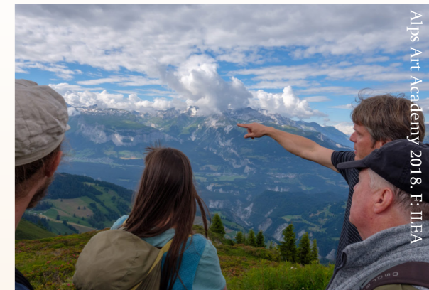
Alps Art Academy 2018, F. ILEA

Learning from the Earth ist ein Aufruf zum Handeln und lädt ein, gemeinsam auf eine sich verändernde Welt zu reagieren und sich mit Zukunftsvisionen in all ihren wissenschaftlichen und künstlerischen Verästelungen auseinanderzusetzen. Wir hoffen, dass die Akademie, wie auch die parallel stattfindende Biennale, das Symposium und die Forschungsprojekte alternative und doch miteinander verbundene Visionen für unseren Planeten bieten, Denkanstöße erzeugen und individuelle und kollektive Träume zum Handeln hervorbringen.