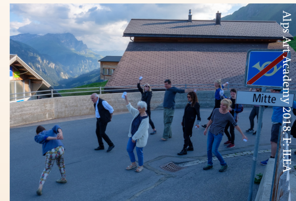
Alps Art Academy 2018, F. ILEA