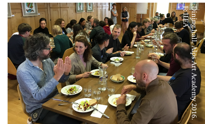
Dining hall, Alps Art Academy 2016.