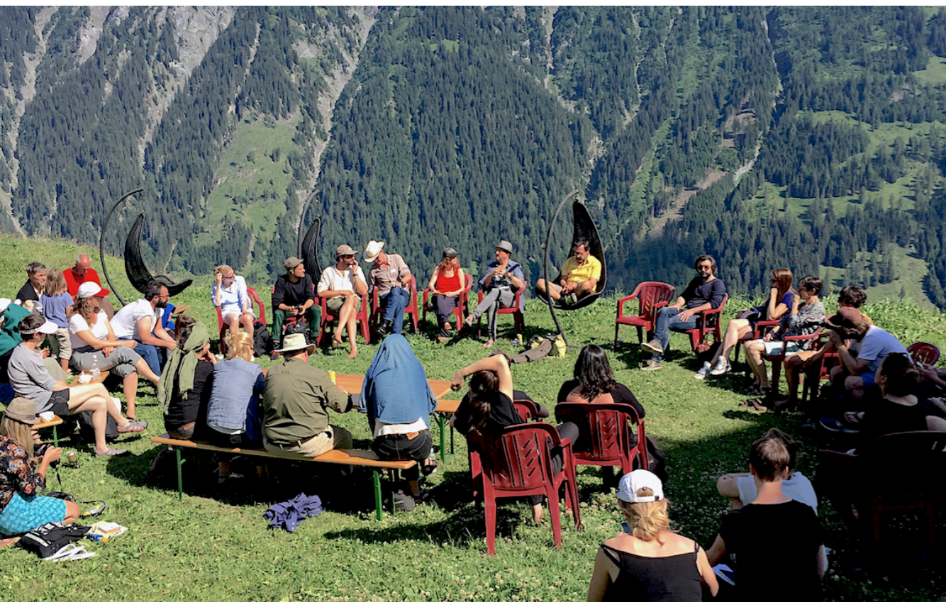
Outdoor Seminar, Alps Art Academy 2018.

Die Akademie lädt Kunstschaffende sowie Theoretiker:innen, Vermittler:innen und Kurator:innen ein, im Rahmen von Workshops, Seminaren, einem Symposium (ILEA TALKS), Künstlergesprächen und Exkursionen den Begriff der Land and Environmental Art unter zeitgenössischen und lokalen Aspekten zu diskutieren, weiter zu denken und zu bearbeiten.