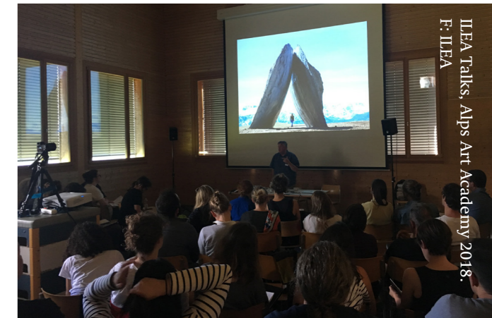
ILEA Talks, Alps Art Academy 2018.

Die ALPS ART ACADEMY fungiert sowohl als lokaler wie internationaler Netzwerk-Hub und als Sprungbrett: so wurden in den letzten Jahren regelmässig ehemalige Teilnehmer:innen in die folgenden Biennalen integriert, oder sie wurde in die Organisation von Akademie und ILEA mit eingebunden.