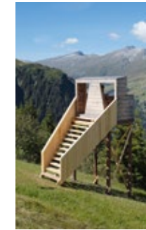
Die Bergkanzel der Künstlergruppe Com&Com wird zu jeder Art Safiental an einem anderen Ort errichtet

Das sieht Ursina Waldburg-Reber vom Gaslihof im Dorf Safien Platz genauso. Auch diese