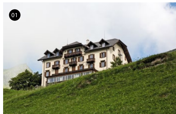
(1) Richtungsweisend: Das Hotel Alpenblick, einst Symbol der Moderne, soll durch neue Architektur wieder zeitgemäß werden